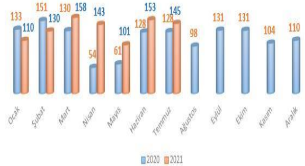
Aylık bazda 2020 yılı ile karşılaştırmalı ihracat değerleri - milyon dolar

İtalya'nın bu ürün grubumuzun toplam ihracatı içerisindeki payı %10,3 olarak hesaplanmaktadır.